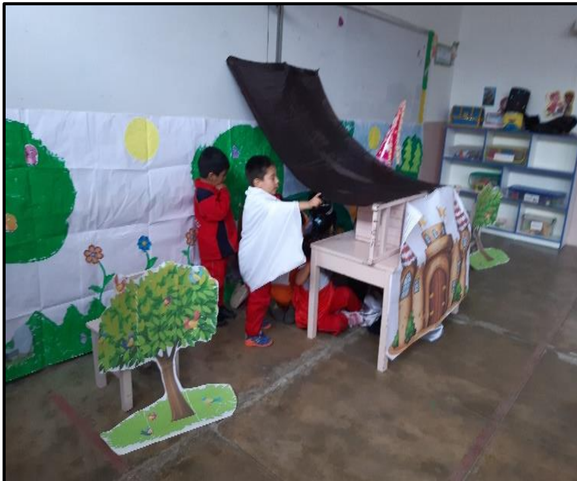
Los niños y niñas dramatizando los personajes que más les gusta interpretar.