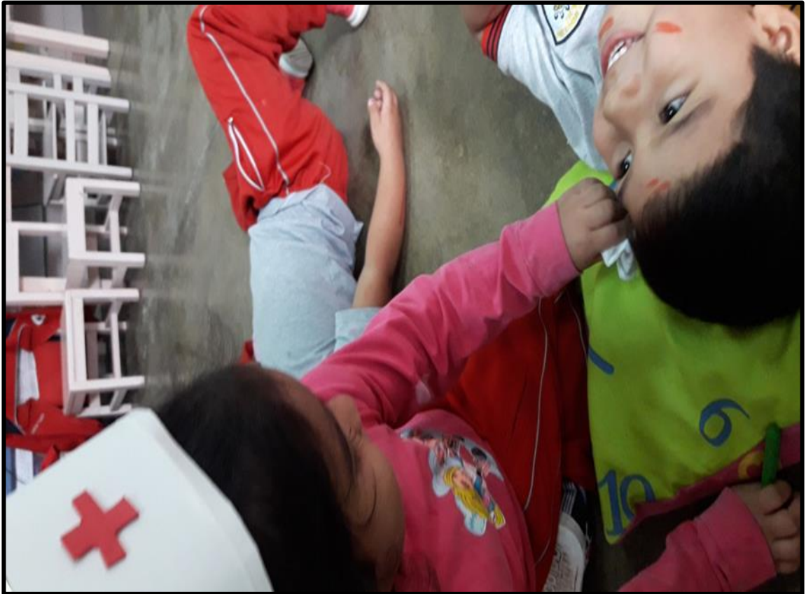
Niños y niñas jugando a los enfermeros y policías.