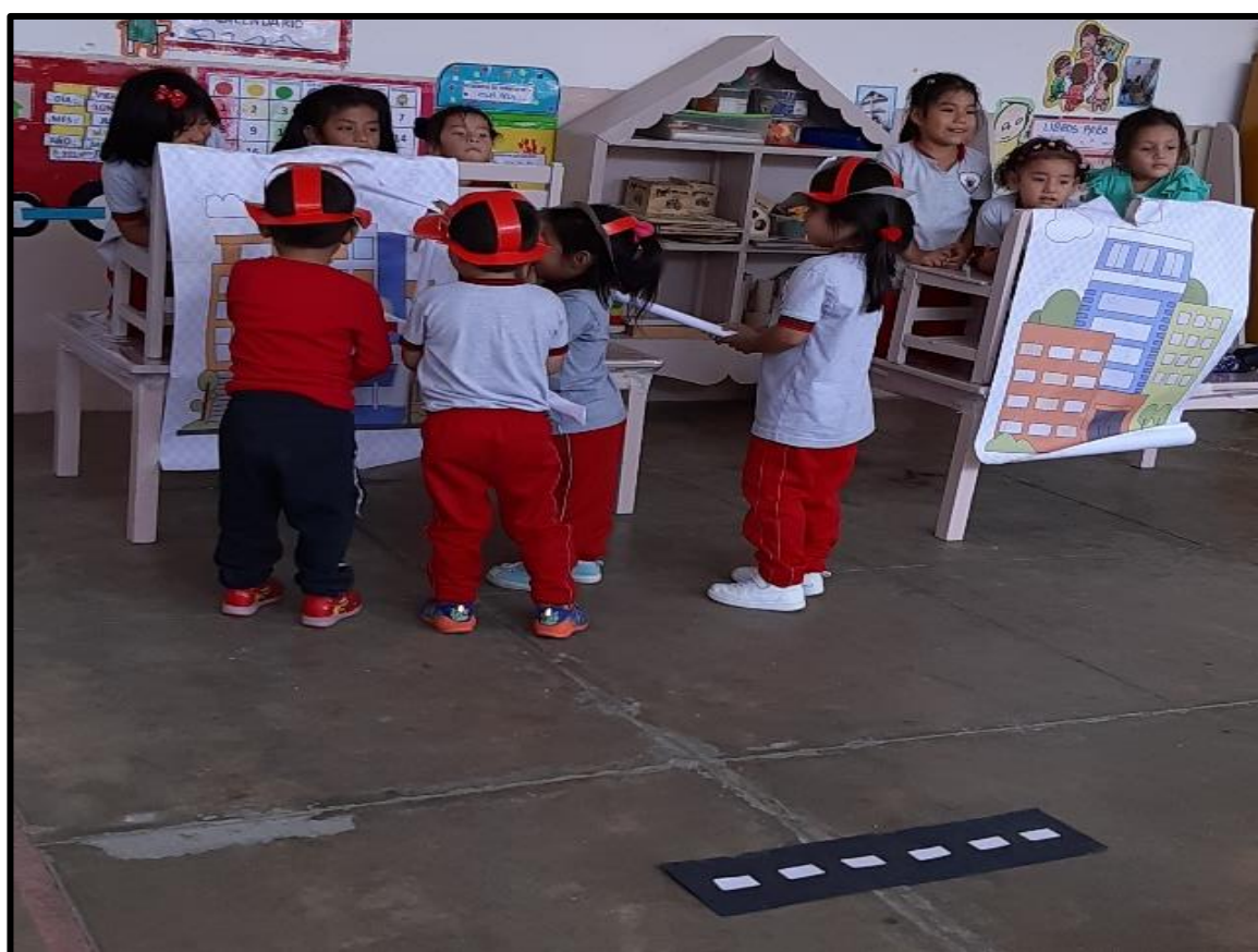
Niños y niñas representando un incendio.