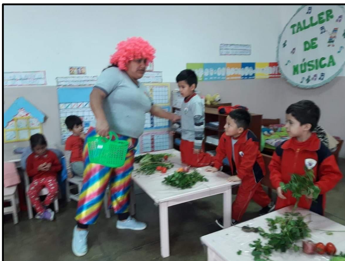
Representación de los niños y niñas interpretando el mercado.