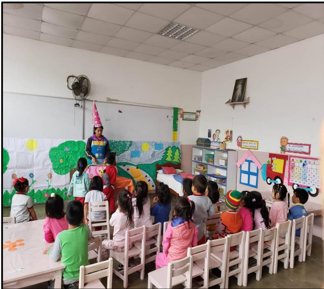
Presentación de los materiales a utilizar.

¿Qué hicimos el día de hoy? ¿Qué cuento dramatizamos?, ¿Con quiénes lo hicimos?, ¿Qué dijimos?, ¿Qué materiales utilizamos?, etc.