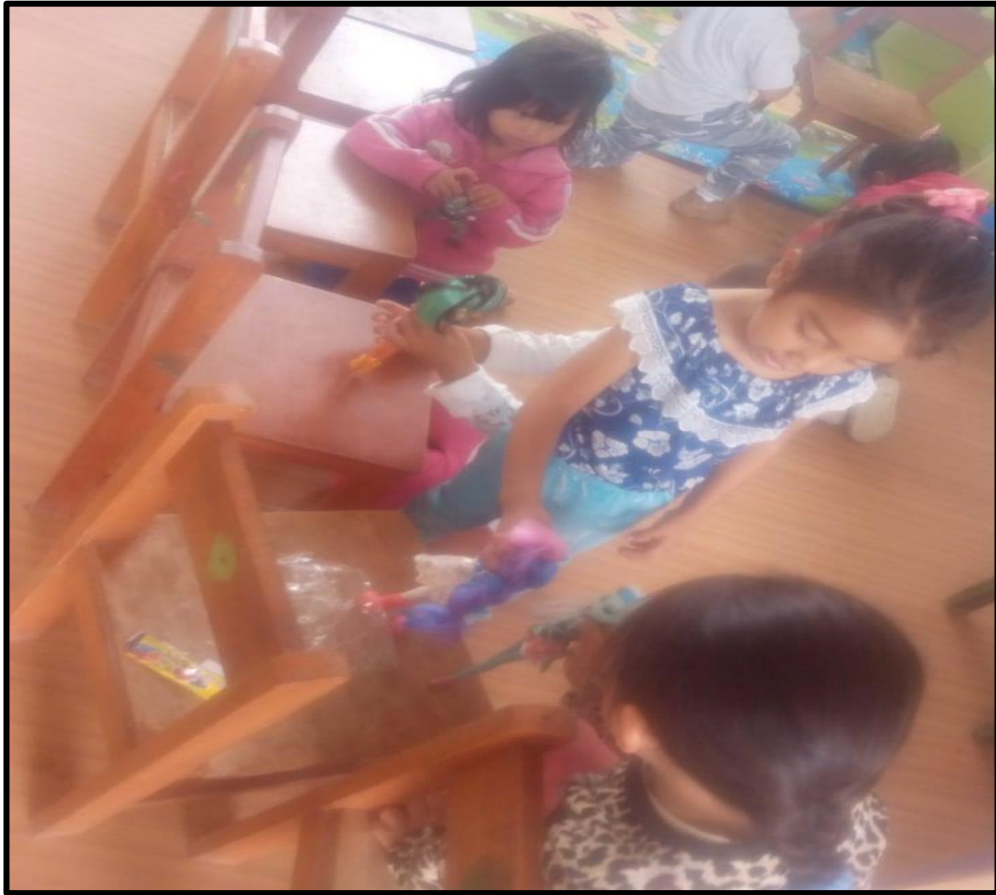
Los niños y niñas interpretando a sus personajes favoritos con sus juguetes.