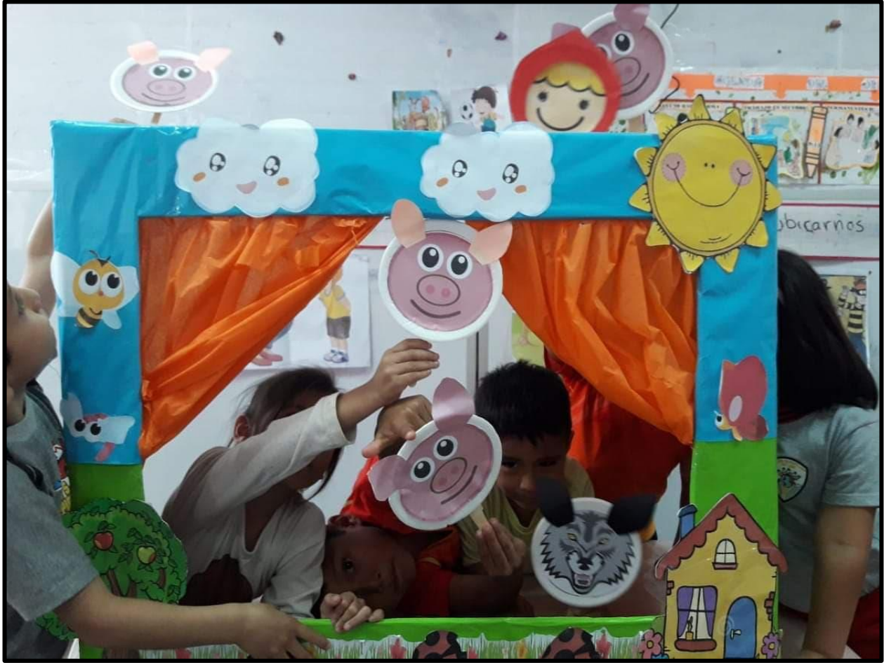
Niños y niñas interpretando su cuento favorito.