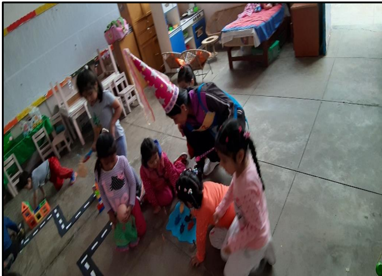
Los niños y niñas juegan con sus juguetes favoritos en diferentes espacios del aula.