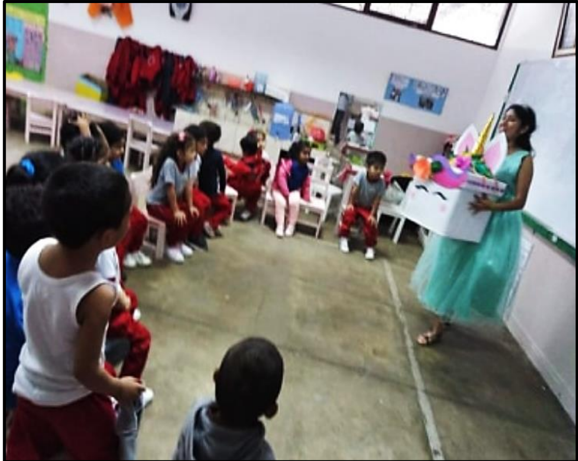
Presentación del personaje: "La princesa de los juegos."