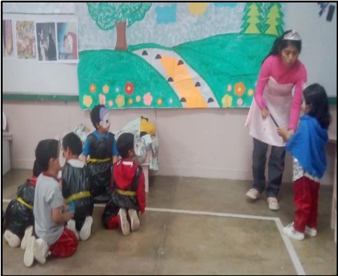
Dramatización del cuento “Blanca nieves y los siete enanitos”