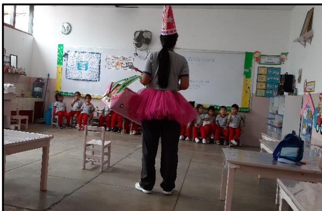
Presentación del personaje: "El hada de los juegos"