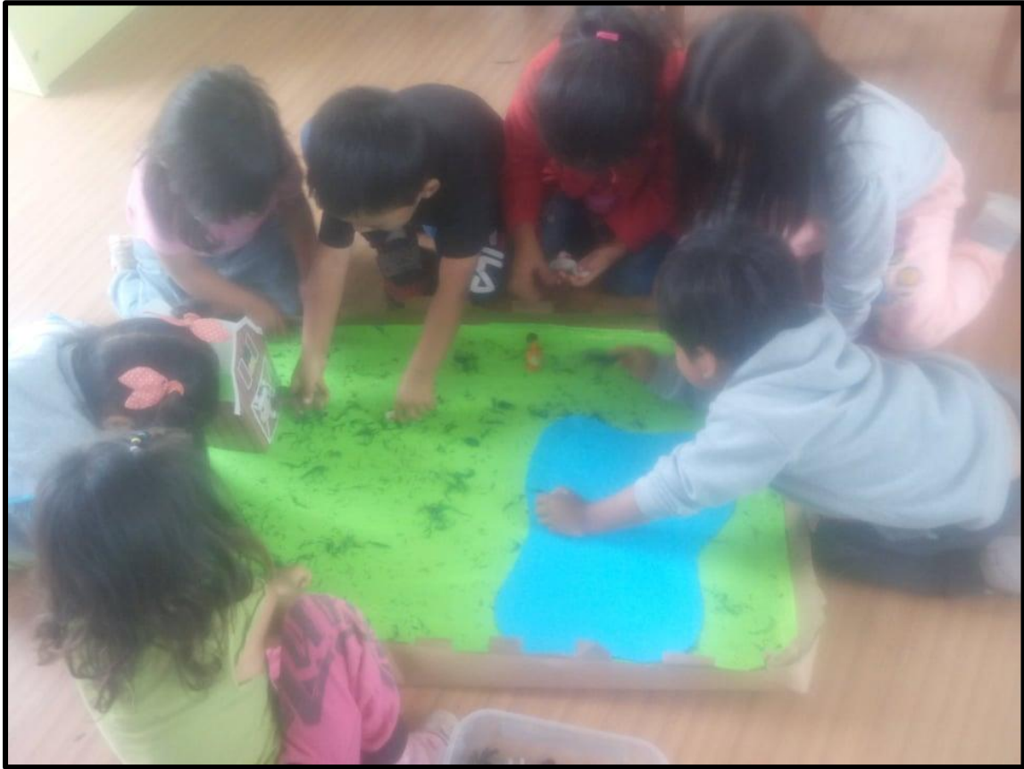
Niños y niñas jugando a ser granjeros.