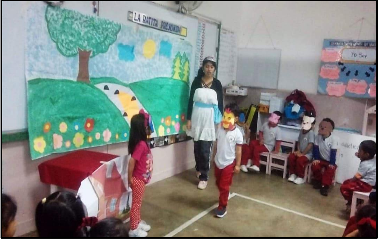
Niños y niñas dramatizando el cuento: "La ratita presumida"