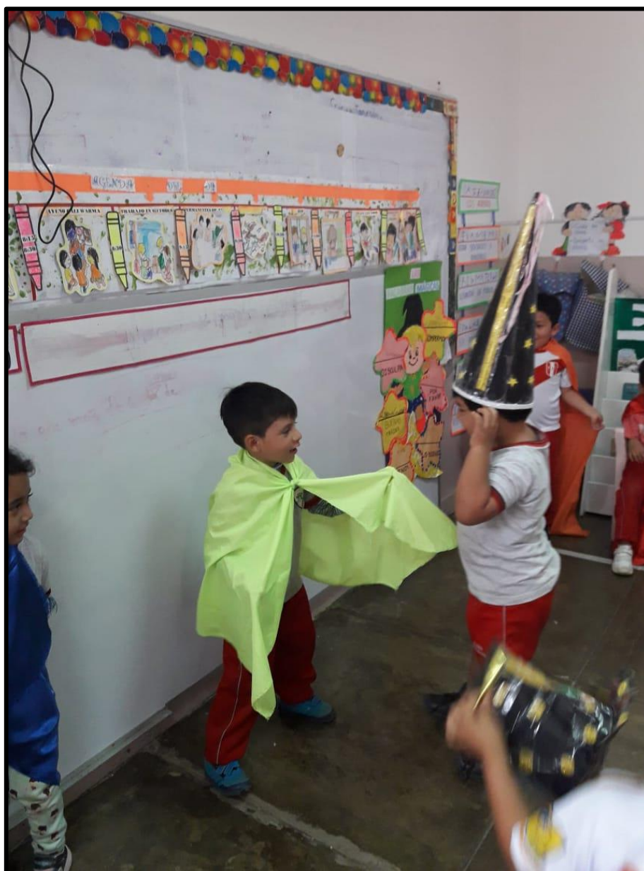
Los niños y niñas dramatizando a sus personajes favoritos en diferentes escenarios del aula.