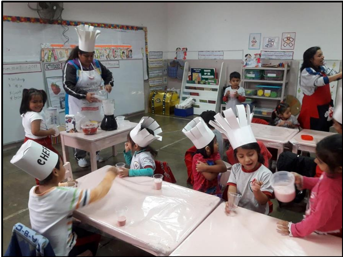
Niños y niñas jugando al restaurante.