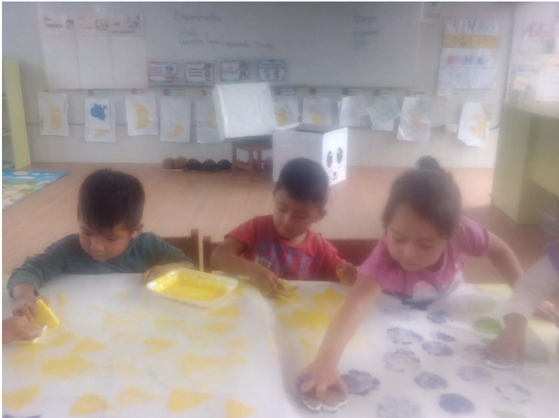
Niños y niñas estampando sus polos.